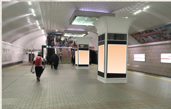
■ 梅田ホームビジョン