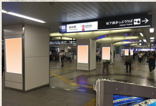
■ 梅田コンコースビジョン