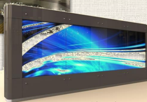
■ なんばパノラマビジョン