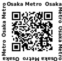
Osaka Metro ホームページ

Osaka Metroでは、ホームページやYouTubeのほか、SNS、MaaSアプリなどお客さまとの様々な接点を活用して、安全・安心をお伝えするお知らせやサービスの情報を提供しています。