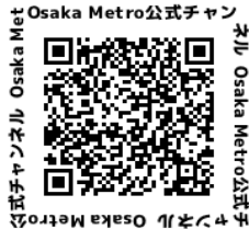
Osaka Metro 公式チャンネル (YouTube)