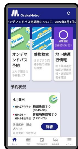
アプリトップ画面