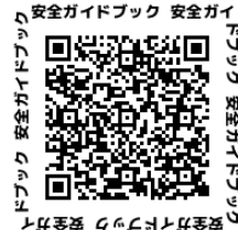
Osaka Metro 安全ガイドブック